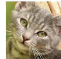
Dienstleistungen für Katzen